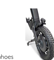
Band grof profiel